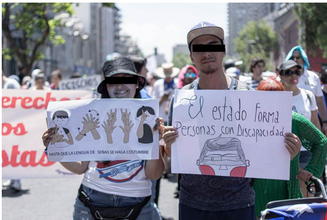
Photo n° 7. Revendications pour une culture sourde et une vie digne.

Description de l'image : Les participants à la marche sont représentés. Deux personnes, une femme et un homme, posent avec leurs affiches. La première montre des images de mains signant en langue des signes et, en dessous, le texte suivant : « Jusqu'à ce que la langue des signes devienne une habitude ». Sur la seconde affiche, on peut lire « L'État fabrique des personnes handicapées » et un dessin représentant le visage d'une personne avec un drapeau chilien en guise de bandeau.