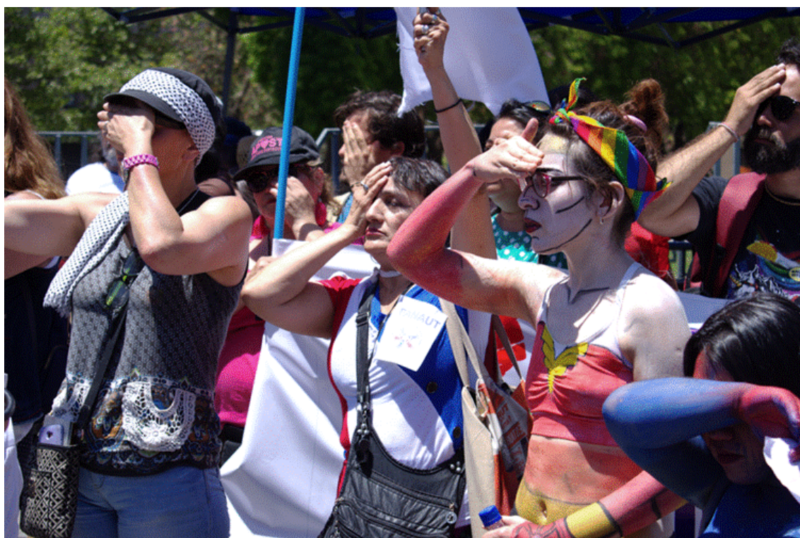
Photo n° 8. Dénonciation faite par des personnes aidantes des mutilations oculaires lors de la révolte sociale.