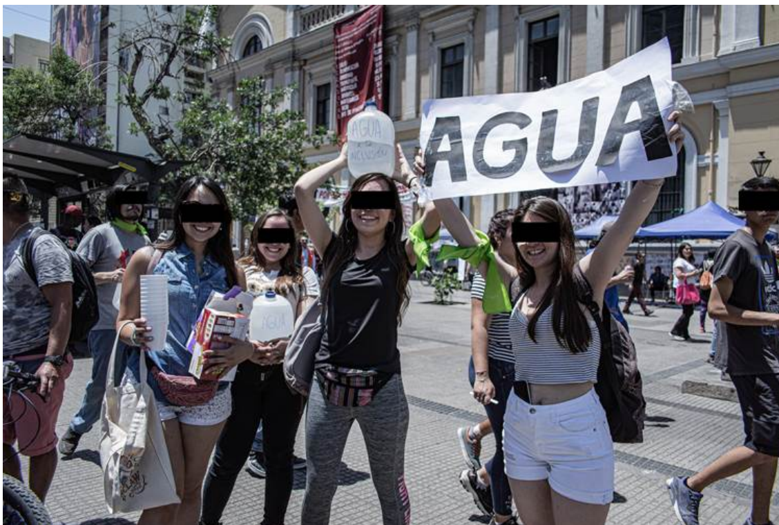
Photo n° 5. Soutien et prise en charge des participants à la marche.

Description de l'image. Cette image présente des participants à la marche mettant l'accent sur quatre femmes tenant des bidons d'eau, des gobelets et des boîtes de barres de céréales. Au moins deux d'entre elles portent un ruban vert au bras. Elles arborent une pancarte sur laquelle on peut lire « eau » en grosses lettres et en majuscules ; sur l'un des bidons on a écrit « eau pour l'inclusion », tout comme sur une autre pancarte. À l'arrière-plan, on peut voir la façade du bâtiment central de l'Université du Chili.