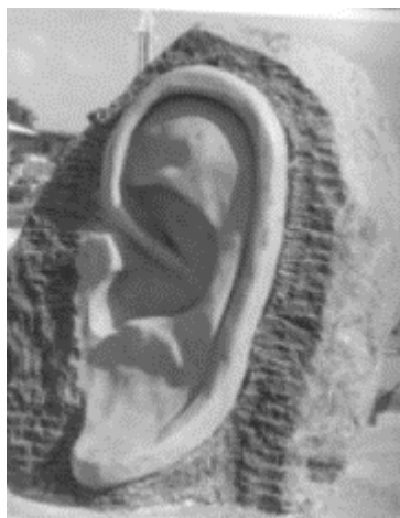
Figura 1: Fotografía de la escultura «Ma Sourde Oreille», Baie-Mahault, Guadalupe.

deseo de igualdad y de acceso equitativo a los derechos (en términos de prestaciones, estructuras y servicios), que coexisten con una búsqueda de autonomía y una reivindicación de singularidad cultural y corporal. Estas reivindicaciones son compartidas por muchos miembros de la comunidad sorda de Guadalupe, que se han unido recientemente para formar el "Mouvement Citoyens Sourds" (Movimiento de Ciudadano de Sordos). Este colectivo se formó en respuesta a la inauguración, en noviembre de 2018, de una obra de arte llamada "Ma sourde oreille" (Mi oreja sorda), instalada en una rotonda para atraer a los automovilistas. Para el colectivo, el símbolo elegido de la oreja transmite la representación de una carencia vinculada a la ausencia de un sentido, desde una perspectiva patologizante: "la sordera aprehendida desde el ángulo de la deficiencia y la 'minusvalía'", mientras que el logotipo "Manos sobre fondo azul" [pictograma que simboliza la lengua de señas] "[habría enfatizado en cambio] la accesibilidad en Lengua de Señas y su reconocimiento como la lengua franca de los Sordos" 10 .